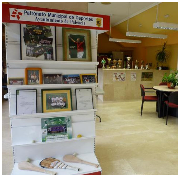
Exposición 25 aniversario Club Frontenis Palencia

Diciembre: Fiesta Aniversario con exposición de fotos y trofeos y Cto. Interno C.F.P.