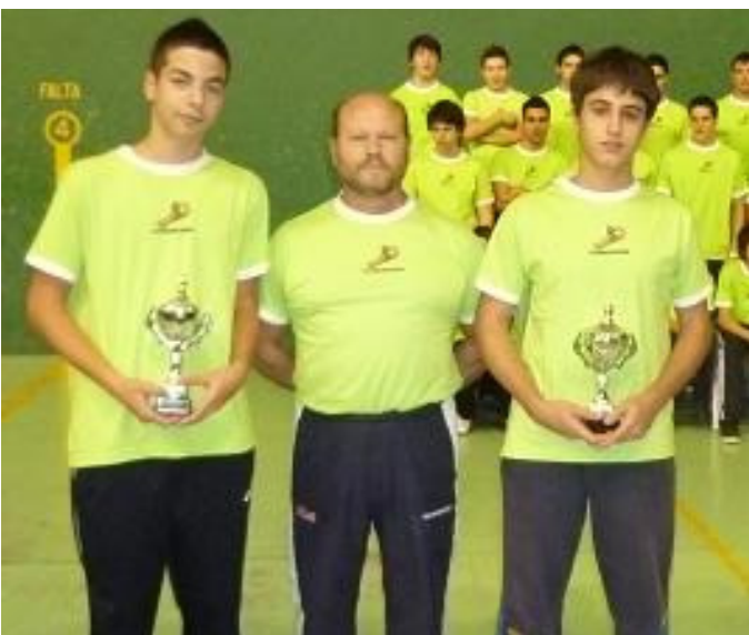
Pareja número 1 Ranking de Castilla y León

En cuanto a la organización se comenzó con el Trofeo Ciudad de Palencia de Olímpica entre los años 1987-1991 , participando los mejores jugadores nacionales del momento en esta modalidad. Un campeonato juvenil hoy denominado Rubén Verdú, incluido en el circuito nacional de abiertos de edad, este año será su XXIII edición. Y las 24 Horas de Frontenis, campeonato que ha ido evolucionando desde regional con preolímpica sin presión a nacional con preolímpica con presión, luego unos años con olímpica y este año volvemos a preolímpica, también incluido en el circuito nacional de