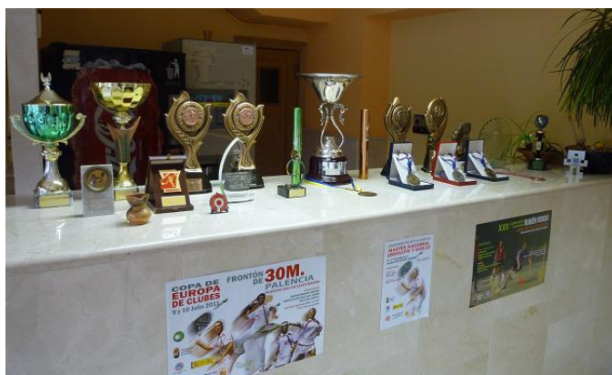
Exposición 25 aniversario del Club Frontenis Palencia

En los comienzos son varios los temas que mas preocupan, como son: captación de jóvenes (escuela), competición para todos los socios (campeonatos sociales), competición para los de mas nivel deportivo (provinciales, regionales, nacionales) y organización de eventos importantes a nivel nacional para que los jugadores palentinos y de la región puedan comprobar el nivel de los jugadores nacionales (Trofeo Ciudad de Palencia de Olímpica).