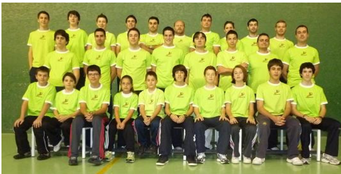
Club Frontenis Palencia Temporada 2011/2012

Delegado Provincial de Pelota y Vicepresidente del Club Frontenis Palencia