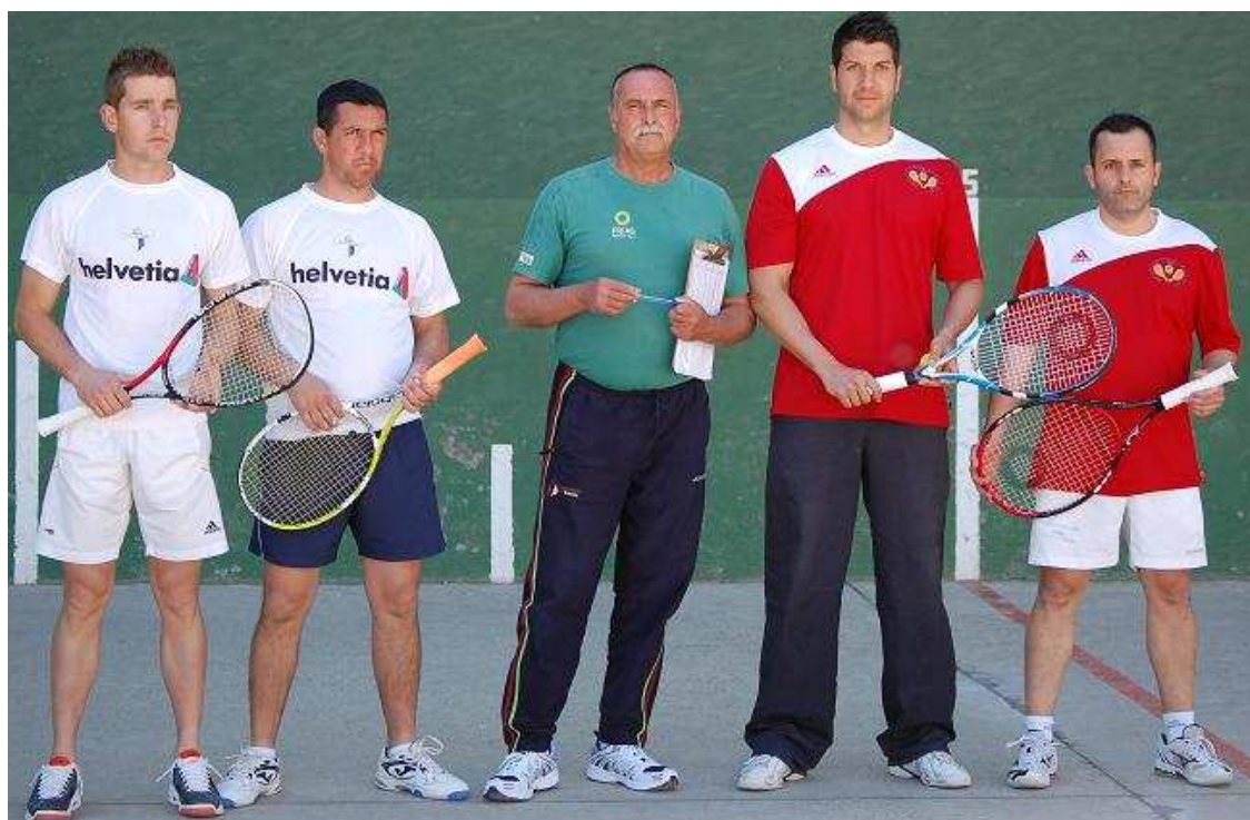
IV Torneo Ciudad de Écija 2012

Asociación de Frontenis Ciudad del Sol-Écija