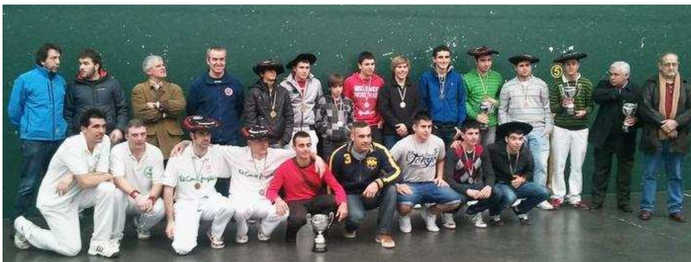
Campeonato de Euskadi de Clubes 2012