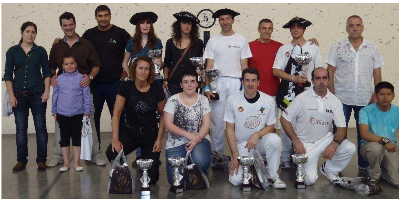
Foto de grupo del Club Frontenis Navarra