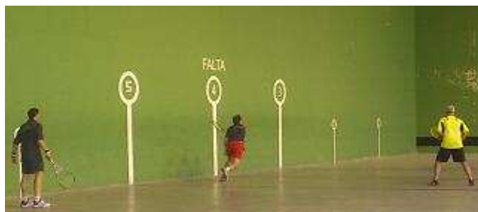
Disputa de una de las semifinales