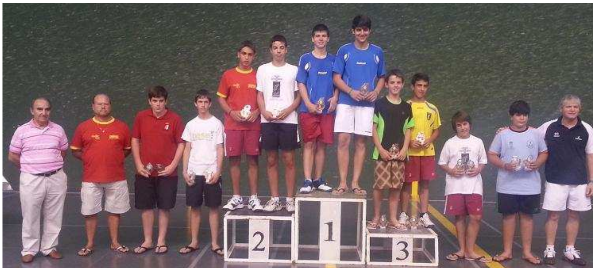
Pódium Categoría Cadete Masculino. Abierto Nacional de Edad Rubén Verdú en Palencia