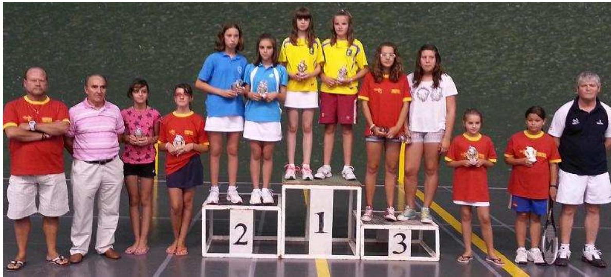
Pódium Categoría Infantil Femenino. Abierto Nacional de Edad Rubén Verdú en Palencia