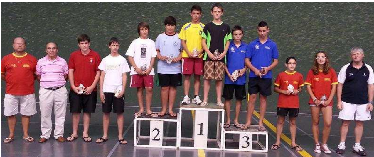
Pódium Categoría Infantil Masculino. Abierto Nacional de Edad Rubén Verdú en Palencia