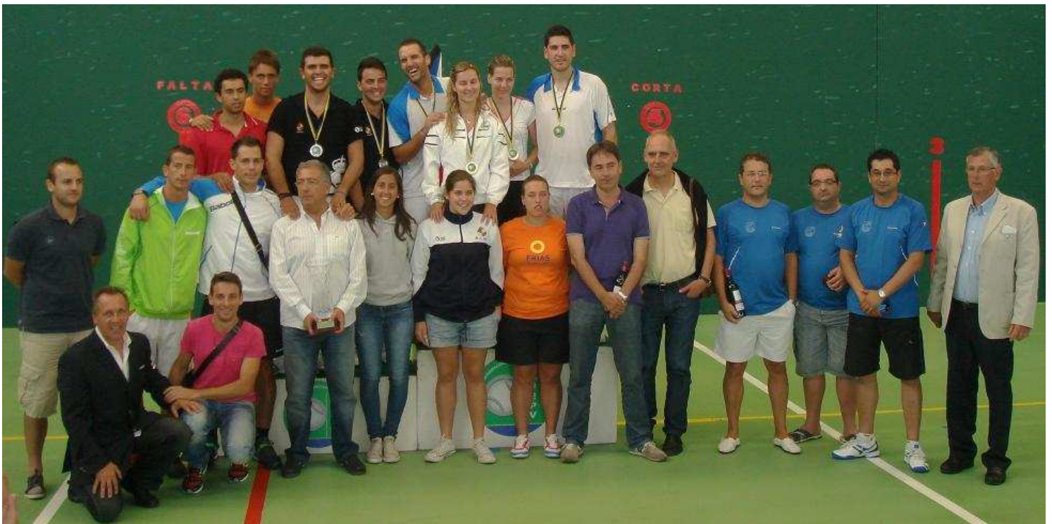
Foto de Grupo Copa e Europa Frontón 30 metros 2012