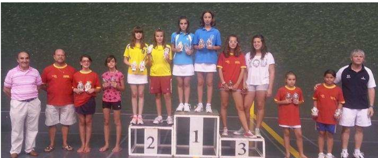
Pódium Categoría Cadete Femenino. Abierto Nacional de Edad Rubén Verdú en Palencia