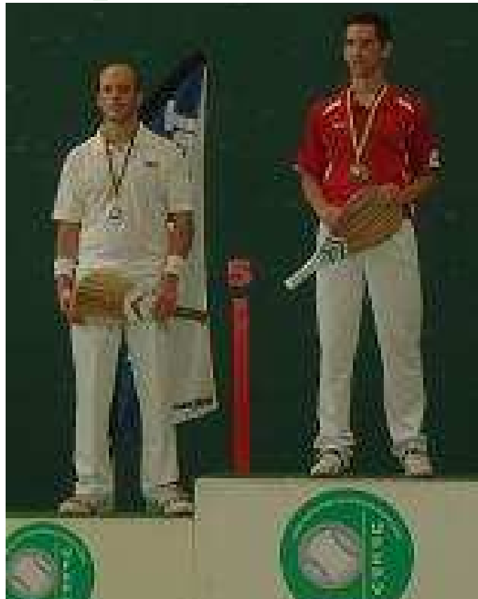
Pódium Paleta Goma Individual