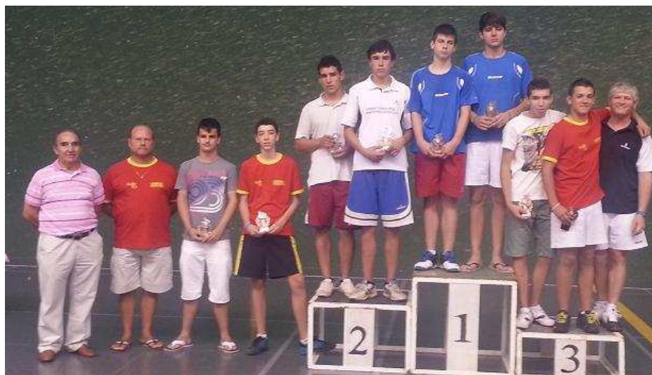
Pódium Categoría Infantil Masculino. Abierto Nacional de Edad Rubén Verdú en Palencia