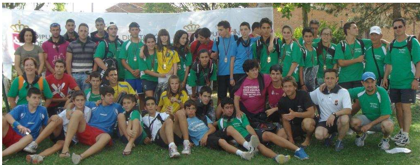
Foto de Grupo. Abierto Nacional de Edad El Paso Tecnifibre