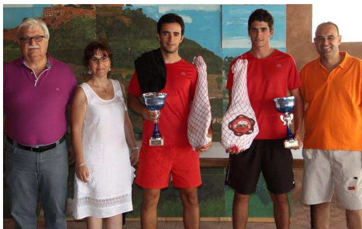
Campeones III 24h de Frontenis de Peraltilla