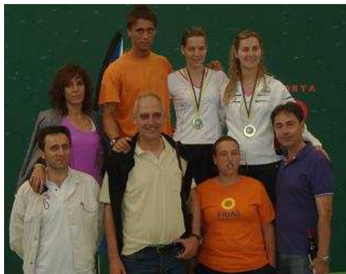
Club Valenciano de Natación Club triunfador Copa de Europa F30 2012