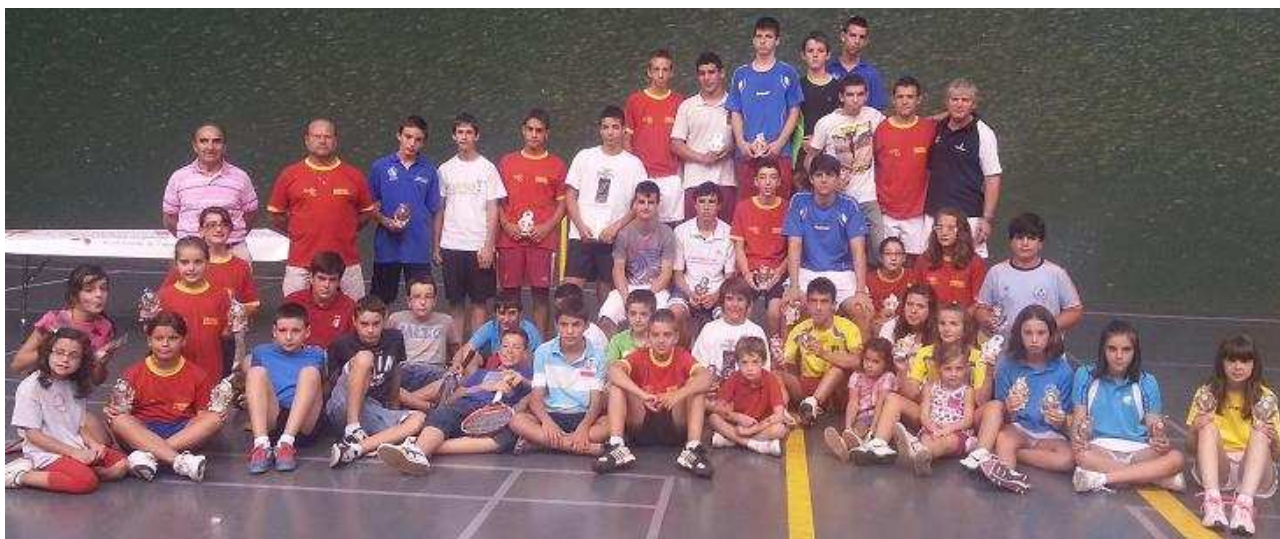
Foto de Grupo. Abierto Nacional de Edad Rubén Verdú en Palencia