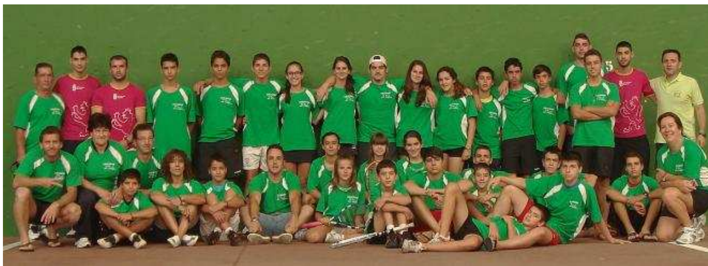
Foto de Familia Abierto Nacional de Edad El Paso Tecnifibre