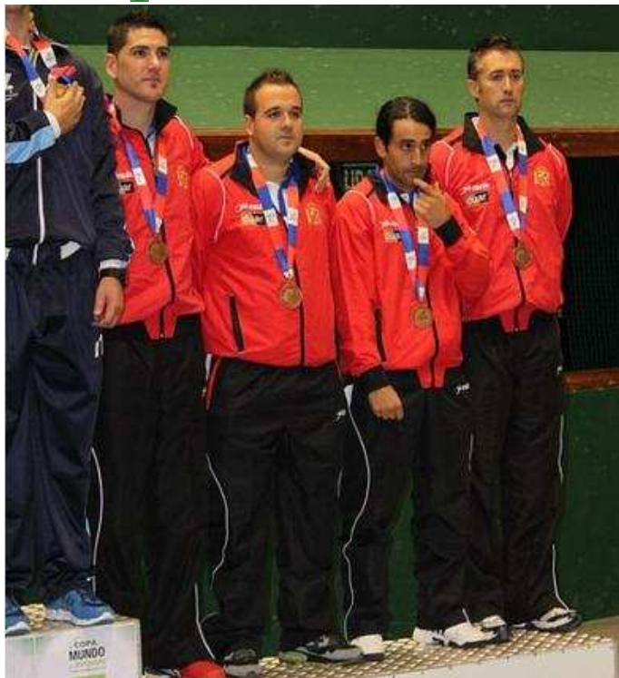
Pódium Selección Española de Paleta Goma en Trinquete