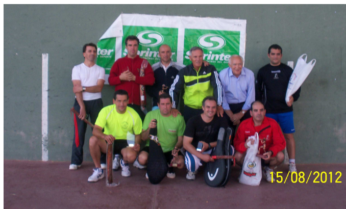
Foto de Grupo