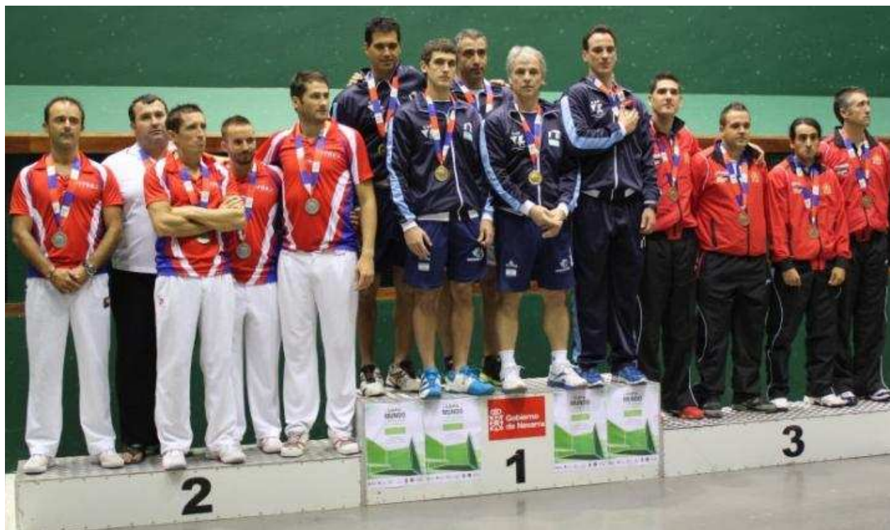
Pódium Paleta Goma Masculina en Trinquete