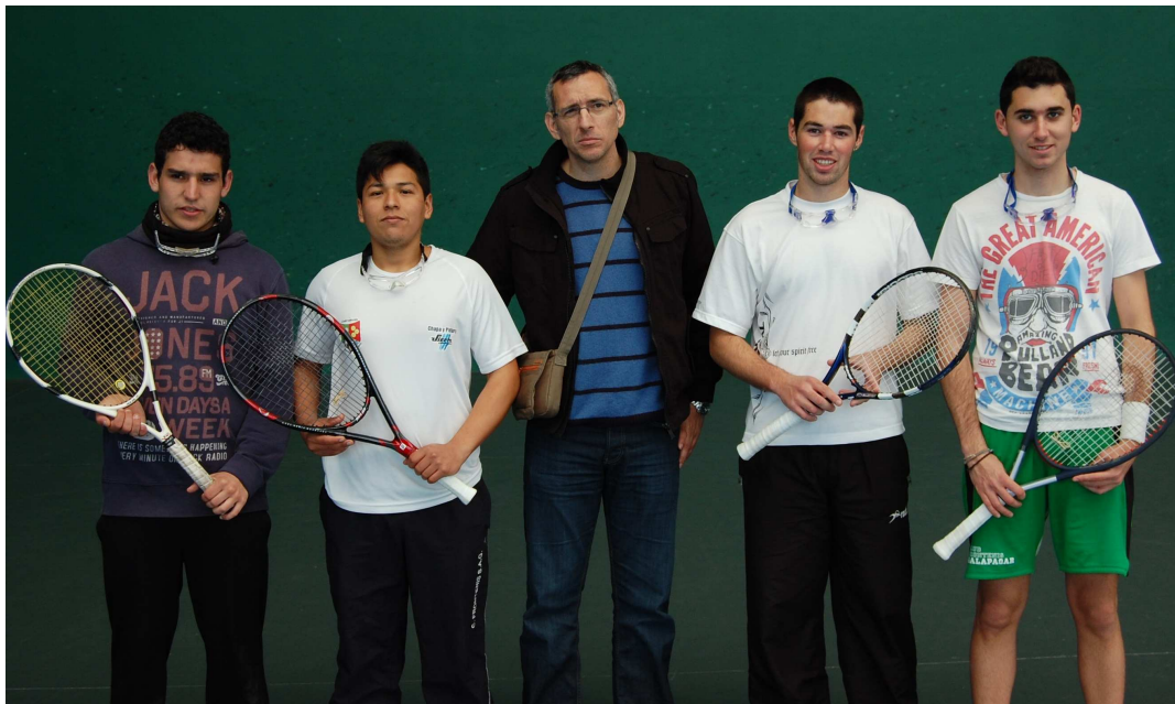
I Torneo Primavera Frontenis Olímpico en Torrejón de Ardoz