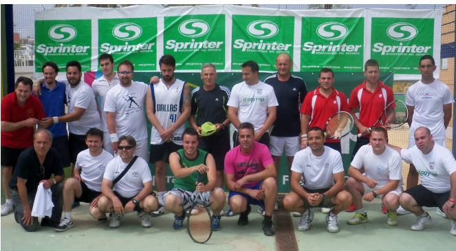
Foto de grupo VII Torneo de Frontenis en Churriana