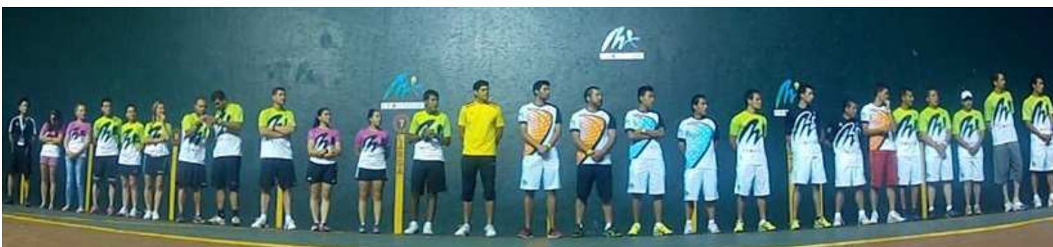
Jugadores MX FRONTOUR