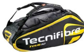
TOUR 12 YELLOW Funda 12 raquetas 6 compartimentos 78 cm x 33 cm x 36 cm