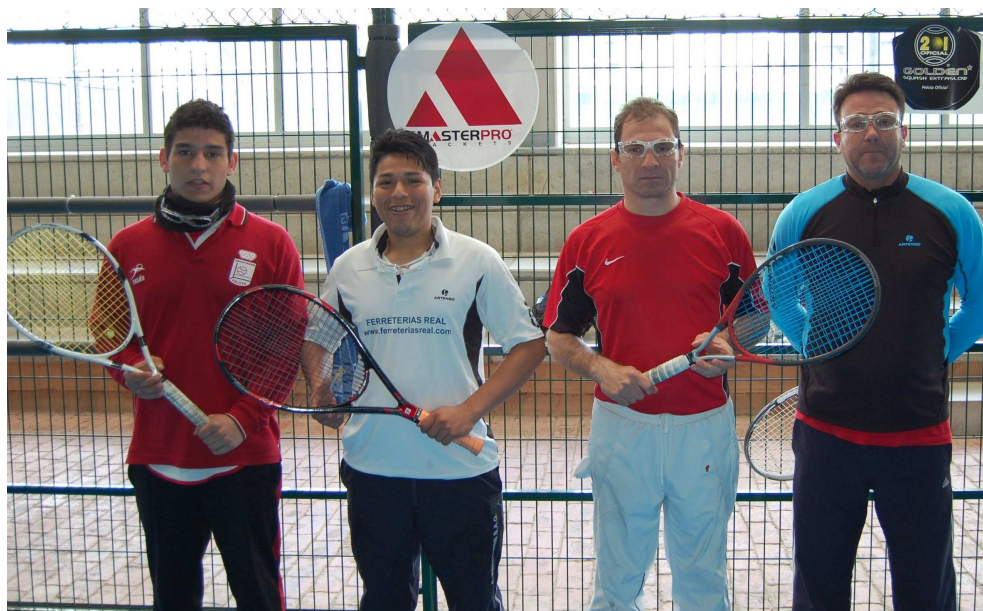
Foto de participantes del Grupo B