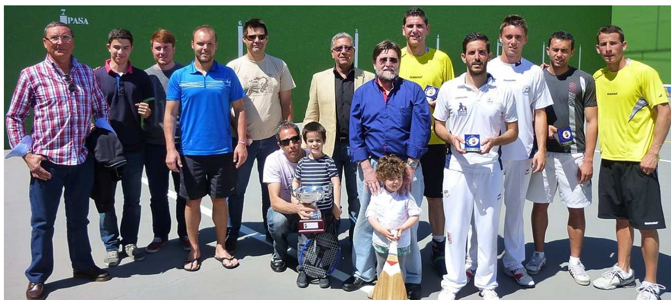
Foto de grupo Campeonato España Paleta Goma Masculina Parejas