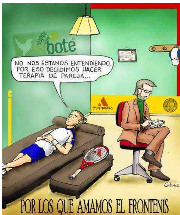
La psicología en el frontenis

En esta ocasión la imagen nos viene de México con una simpática que muestra a un jugador de frontenis con problemas psicológicos.