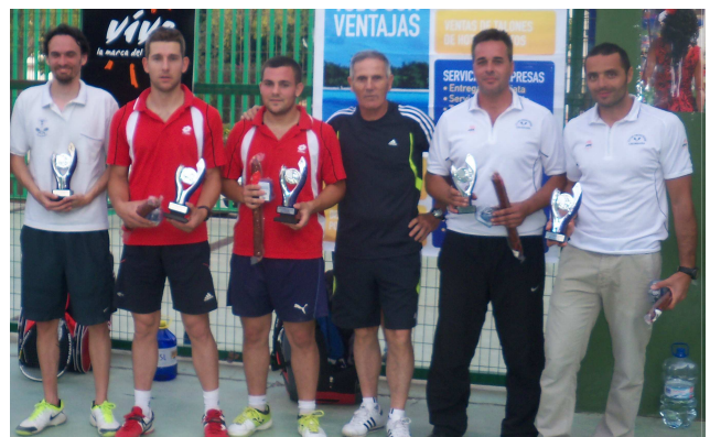
Campeones y Subcampeones