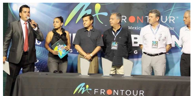
MX FRONTOUR Autoridades presentes