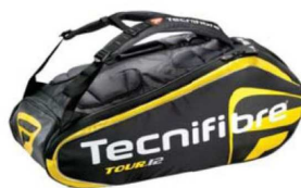
TOUR 12 YELLOW Funda 12 raquetas 6 compartimentos 78 cm x 33 cm x 36 cm