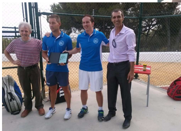
Club Frontenis Montefrío

Sinceramente a título personal y creo que hablo por todos, lo más importante no ha sido quién ha resultado campeón o quién ha quedado en último lugar, lo más importante ha sido como ya he dicho antes, conseguir sacar esta liga adelante, y sobre todo que se haya hecho en un marco de deportividad y compañerismo insuperable, eso es lo mejor, ahí todos hemos sido los campeones.